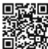
Леон в Инстаграме

МНЕ КАЖЕТСЯ, У КАРЬЕРЫ НЕТ ВЕРШИН: ТЫ ПОПРОБОВАЛ СЕБЯ В МУЗЫКЕ, В БЛОГЕРСТВЕ, В КИНО, В ТЕАТРЕ... Для меня главное — творить, создавать что-то новое и чтобы это у кого-то откликнулось в душе. ◦